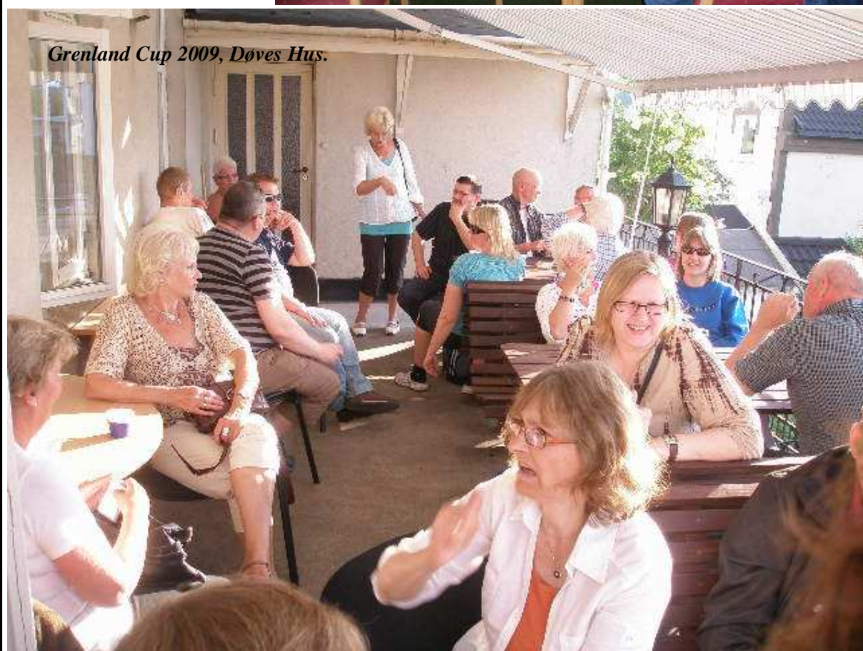
Grenland Cup 2009, Døves Hus.