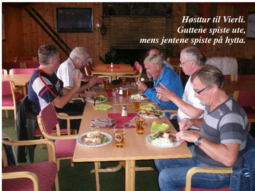
Høsttur til Vierli. Guttene spiste ute, mens jentene spiste på hytta.